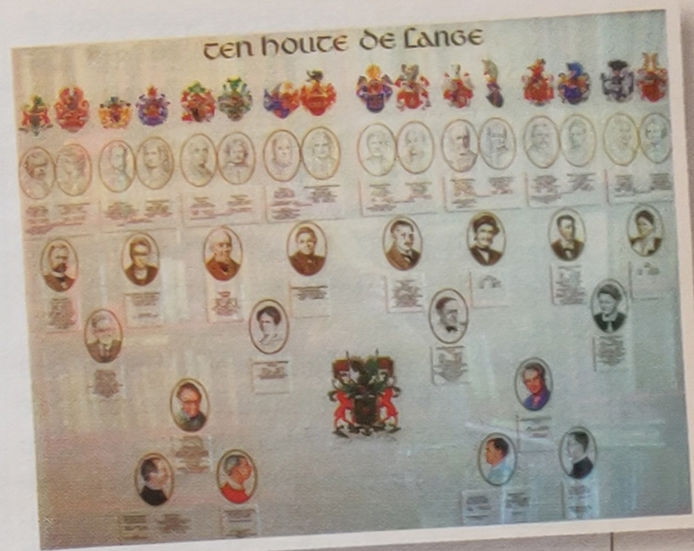
Een kwartierstaat, waarin zowel de mannelijke als de vrouwelijke voorouders zijn opgenomen